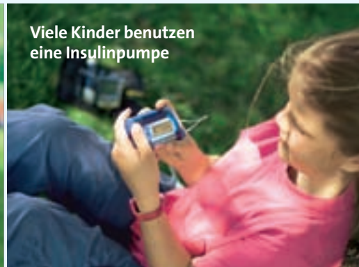
Viele Kinder benutzen eine Insulinpumpe