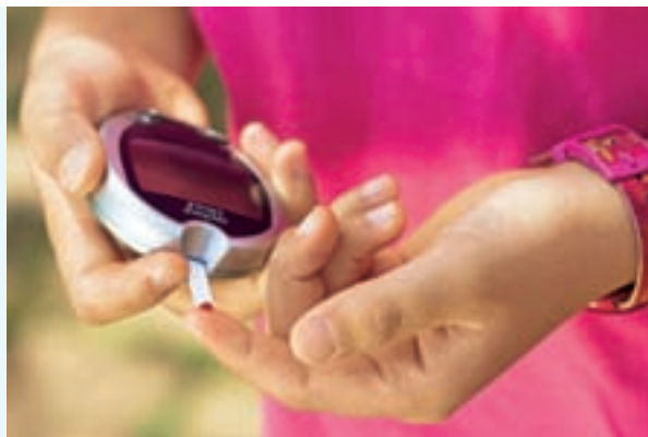
Schnell und einfach: Der Blutzuckertest

Auch während des Unterrichts kann es deshalb nötig sein, den Blutzucker zu kontrollieren. Die Messung geht schnell und ohne großen Aufwand und