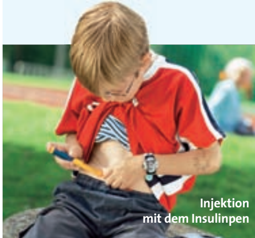
Injektion mit dem Insulinpen